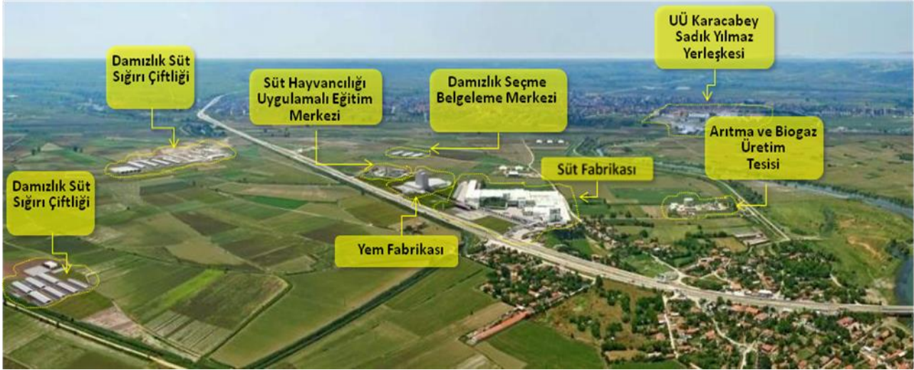
Süttaş Güney Marmara Sütçülük Projesi Karacabey Entegre Tesisleri:

Türkiye süt ve süt ürünleri pazarına 69 çeşit ürün sunmakta olan şirketimizin, Türkiye’de Bursa (Karacabey) ve Aksaray’da olmak üzere, yılda toplam 876 milyon litre süt işleme kapasitesine sahip, 2 adet entegre tesisi bulunmaktadır.